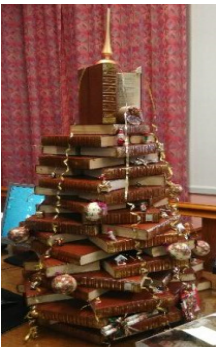
Un sapin de livres