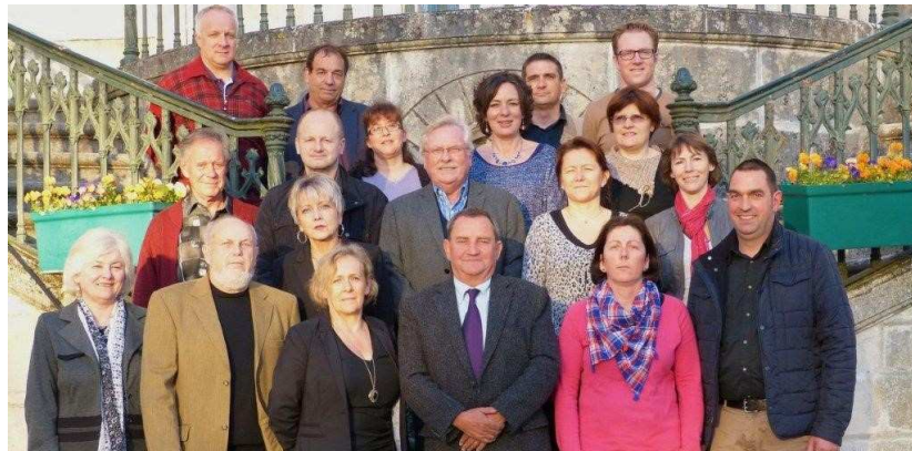
Le nouveau conseil municipal