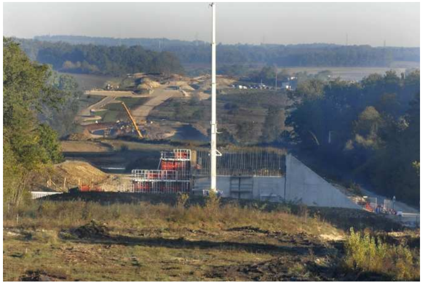
Photo travaux LGV sur la commune de Nersac