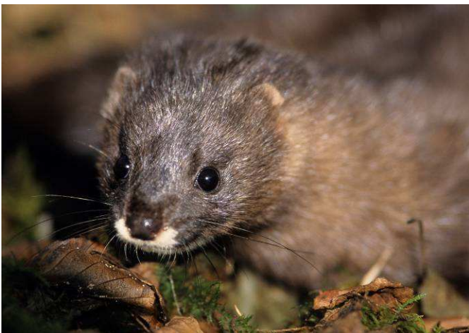
Vison d'Europe

Vous êtes un propriétaire, une collectivité, un gestionnaire ? Vous pouvez agir pour la biodiversité !